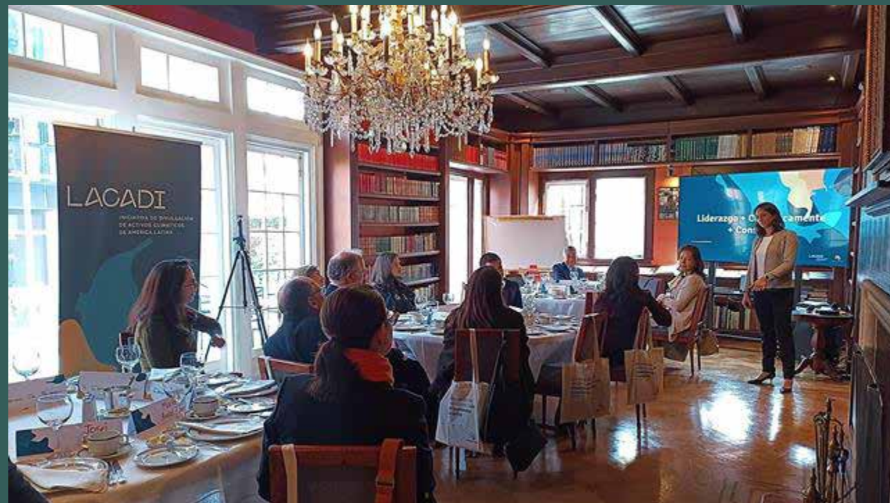
Miembros de Junta - Climate Champions Colombia

Miembros de juntas directivas avanzando en liderazgo consciente del clima a través del aprendizaje entre pares