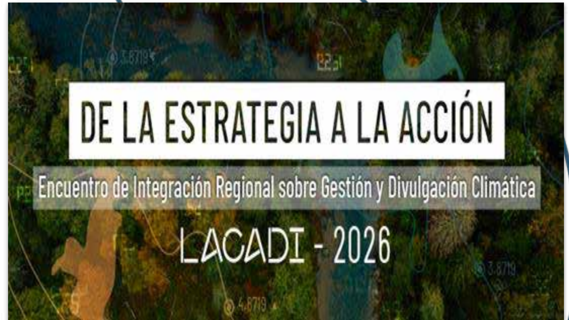
Febrero 26 Lima, Perú.